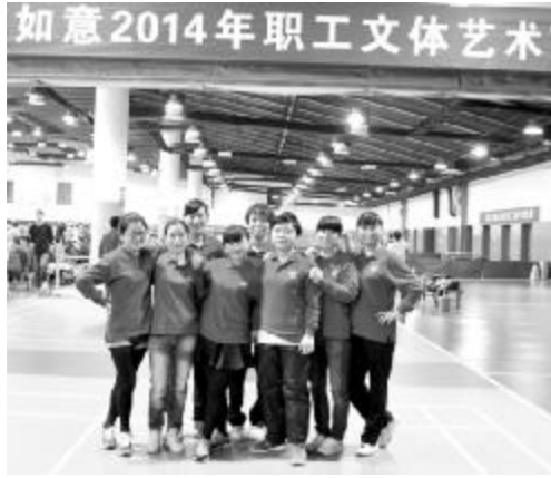
图为羽毛球比赛后队员们合影