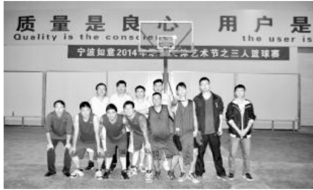
图为篮球比赛后队员们合影