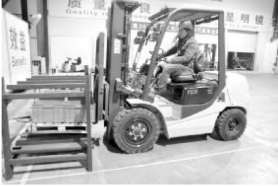
图为队员正在参与叉车比赛